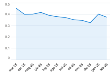
Grafico indice (12 mesi)